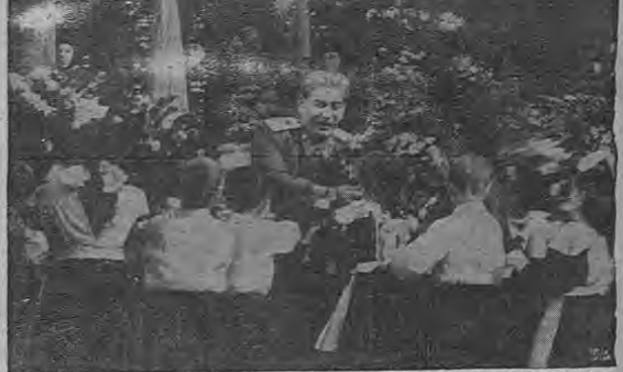
Miembros de Moscú, llamados "exploradores jóvenes" entregaron orgullosos florales al Primer Ministro, Josef Stalin, durante la gran fiesta en la cual se conmemoró el 70º cumpleaños del jefe ruso, en el gran teatro Bolshoi, de Moscú. Stalin cobró su cumpleaños, el 21 de Diciembre.